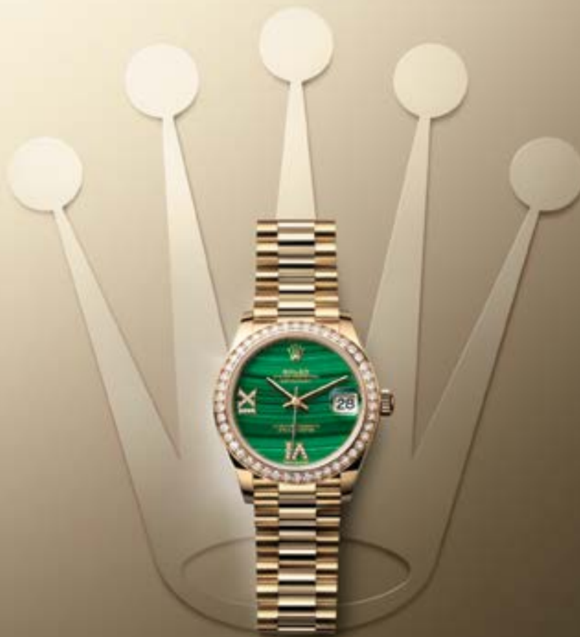
OYSTER PERPETUAL DATEJUST 31