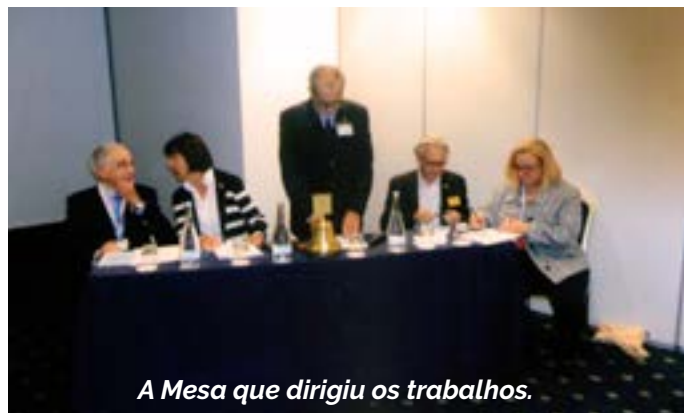
A Mesa que dirigiu os trabalhos.

No âmbito das acções levadas a cabo, foram desenvolvidos contactos tendo em vista alcançar a geminação entre os Rotary Clubes de Vila Nova de Gaia e de La Rochelle-Atlantic, tendo sido entre ambos assinado um Protocolo de Intenção.