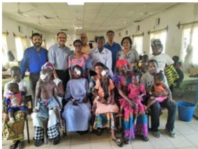
O grupo dos cirurgiões que intervieram posa com alguns dos doentes intervencionados.