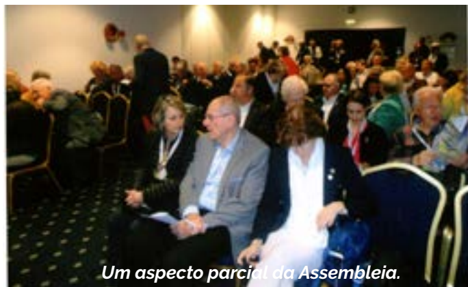
Um aspecto parcial da Assembleia.

Já de tarde, houve lugar a visita guiada ao Palácio da Bolsa e a outros locais de especial interesse do Porto. O jantar oficial terminaria a jornada deste dia e teve de novo lugar em Vila Nova de Gaia, no Hotel "Holiday Inn". O dia 19, domingo, foi preenchido com um belo passeio fluvial no Douro - "Entre Pontes" - com almoço a bordo. Dada a falta de espaço, retomaremos este assunto com mais detalhes na nossa próxima edição.