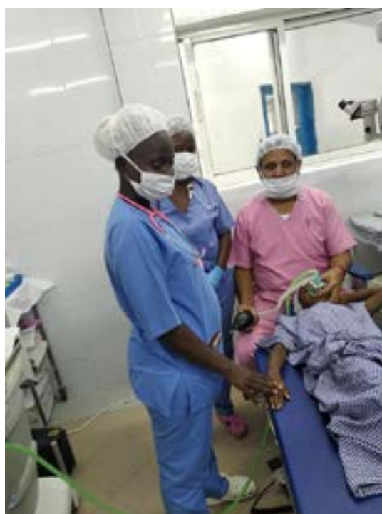
No decurso de uma das cirurgias efectuadas.